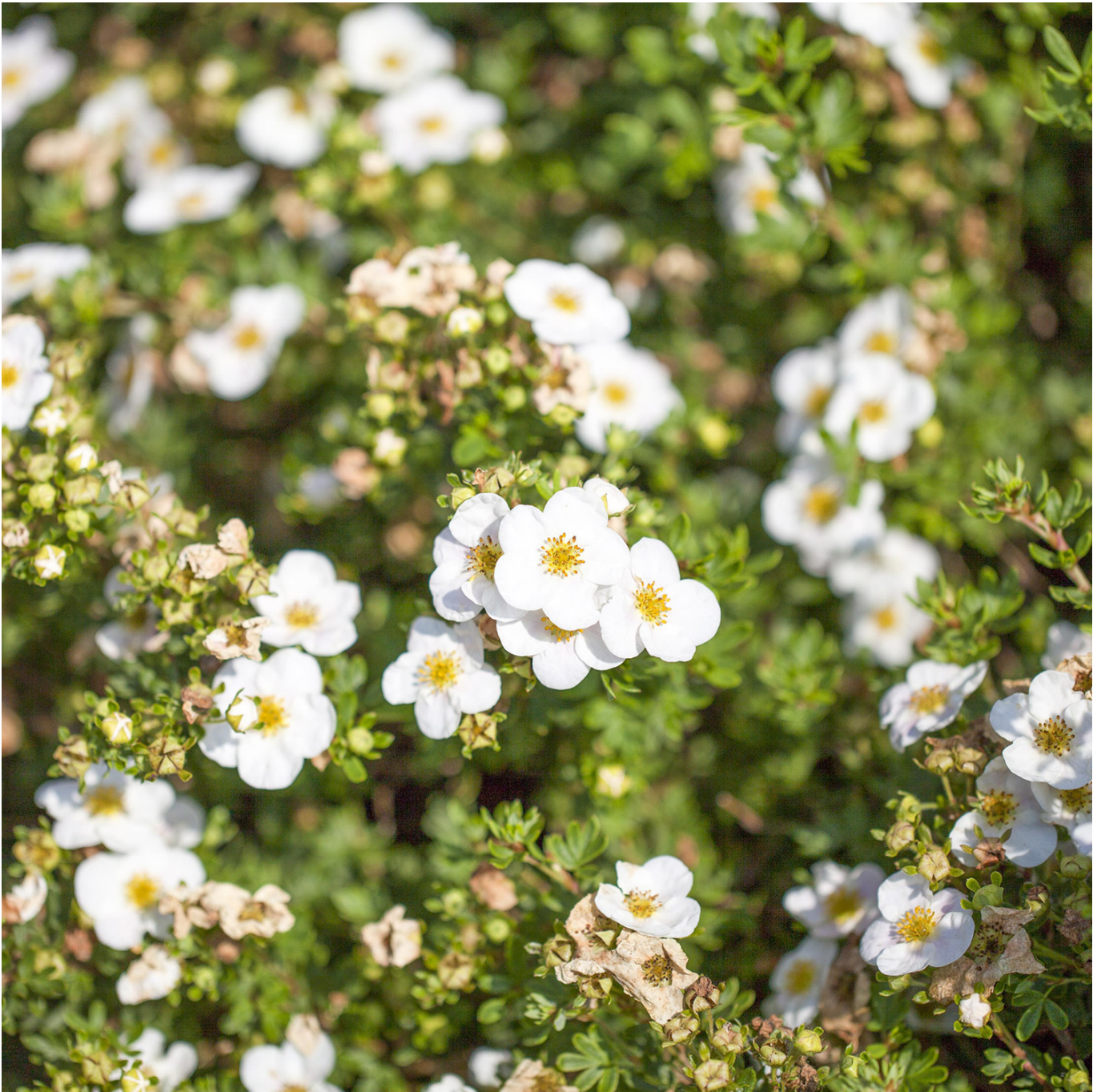
Fingerstrauch 'Abbotswood', P 9, 15 - 20 cm Liefergröße: 15 - 20 cm - Potentilla fruticosa 'Abbotswood'

Fingerstrauch 'Abbotswood': Ein Weißblühendes Highlight für Ihren Garten Strahlende Eleganz: Fingerstrauch 'Abbotswood' Entdecken Sie den Fingerstrauch 'Abbotswood', eine pflegeleichte und robuste Gartenpflanze, die sich perfekt für die Gestaltung von Beeten, Rabatten und als Heckenpflanze eignet. Mit seinen leuchtend weißen Blüten ist der 'Abbotswood' eine attraktive Ergänzung für jeden Garten. Leuchtende Blüten und Robuste Natur Der Fingerstrauch 'Abbotswood' zeichnet sich durch seine strahlenden, weißen Blüten aus, die von Frühling bis Sommer erscheinen. Diese Sorte ist besonders robust und widerstandsfähig gegenüber verschiedenen Wetterbedingungen und Bodentypen, was sie zu einer idealen Wahl für vielseitige Gartengestaltungen macht. Pflege und Standort Dieser anspruchslose Strauch passt sich leicht an verschiedene Standorte an. Er bevorzugt sonnige bis halbschattige Lagen und kommt mit den meisten Bodenarten gut zurecht. Einmal etabliert, ist der Fingerstrauch 'Abbotswood' trockenheitstolerant und bedarf nur minimaler Pflege. Standort: Sonnig bis halbschattig, anpassungsfähig an verschiedene Bodentypen. Wasser: Mäßiges Gießen, trockenheitstolerant nach Etablierung. Pflege: Geringer Pflegeaufwand, ideal für pflegeleichte Gartenbereiche. Vielseitige Einsatzmöglichkeiten Der Fingerstrauch 'Abbotswood' bietet vielseitige Einsatzmöglichkeiten im Garten: Ideal als dekorative Heckenpflanze und für farbenfrohe Beete und Rabatten. Perfekt für die Gestaltung von natürlichen,