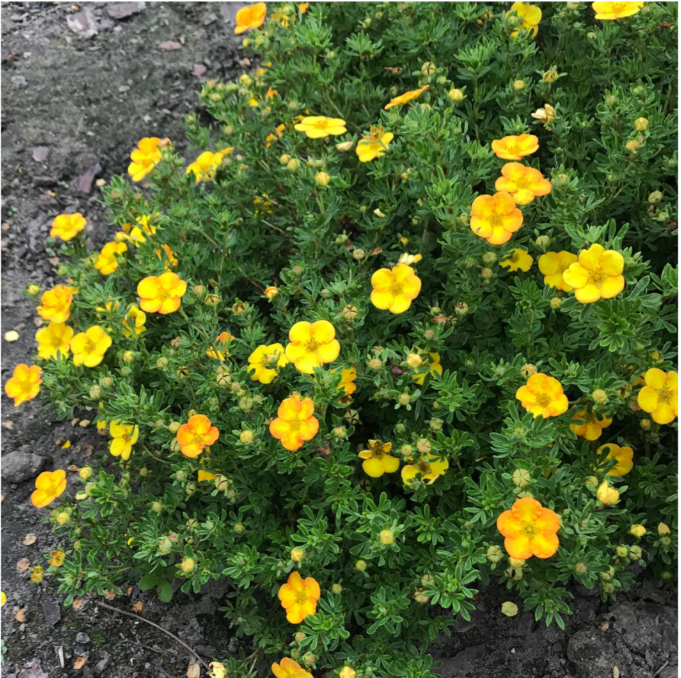
Fingerstrauch 'Bella Lindsey'® Liefergröße: 30 - 40 cm - Potentilla fruticosa 'Bella Lindsey'®

Fingerstrauch 'Bella Lindsey®': Sonnenglanz im Garten Fingerstrauch 'Bella Lindsey®': Ein Hauch von Sonnenschein Der Fingerstrauch 'Bella Lindsey®' verzaubert mit leuchtend gelben Blüten, die eine sonnige und fröhliche Atmosphäre verbreiten. Sein kompakter Wuchs und die reiche Blütenpracht, kombiniert mit attraktiven grünen Blättern, machen ihn zu einer hervorragenden Wahl für jede Gartengestaltung. Ob in kleinen Gärten, in Beeten oder als niedrige Heckenpflanze, 'Bella Lindsey'® bringt Farbe und Lebendigkeit in Ihren Außenbereich. Vorteile des Fingerstrauchs 'Bella Lindsey®' Leuchtend gelbe Blüten: Sorgen für eine lebendige Farbgestaltung und eine positive Stimmung im Garten. Kompakter Wuchs: Ideal für begrenzte Räume und vielseitig in der Gartengestaltung einsetzbar. Reiche Blütenpracht: Bietet über die gesamte Saison hinweg eine attraktive Optik. Pflegeleicht und robust: Passt sich gut an verschiedene Bodenbedingungen an und benötigt wenig Pflege. Pflanz- und Pflegehinweise Der Fingerstrauch 'Bella Lindsey®' bevorzugt einen sonnigen bis halbschattigen Standort mit gut durchlässigem Boden. Regelmäßiges Gießen fördert ein gesundes Wachstum, besonders in trockenen Perioden. Ein leichter Rückschnitt im Frühjahr hilft, die kompakte Form zu bewahren und fördert eine üppige Blütenbildung. Beleben Sie Ihren Garten mit 'Bella Lindsey®' Mit dem Fingerstrauch 'Bella Lindsey®' holen Sie sich das Leuchten der Sonne in Ihren Garten. Die Kombination aus strahlend