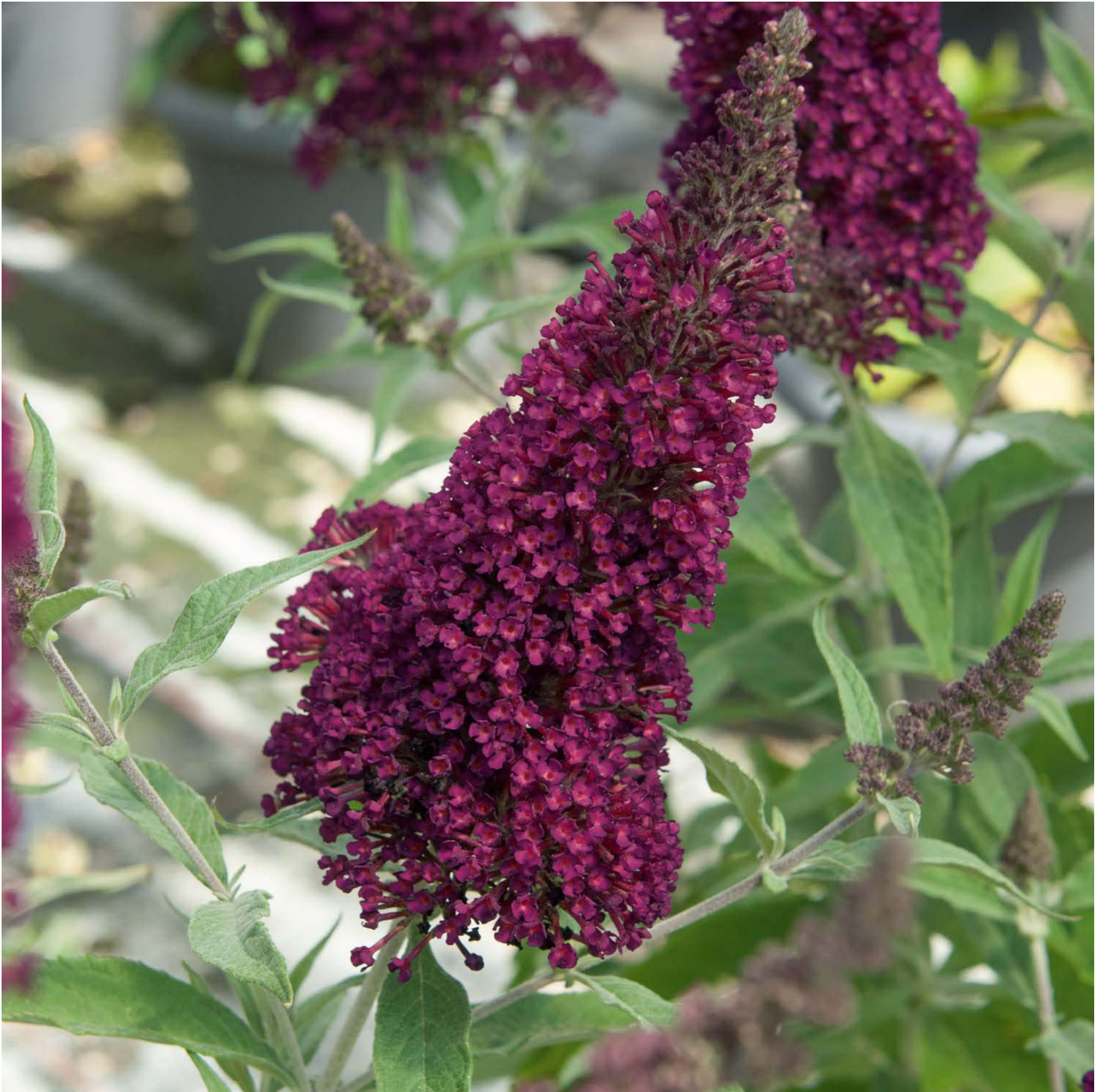
Sommerflieder 'Buzz Wine' Lieferform: Im 3 Liter Topf - Buddleja davidii 'Buzz® Wine'

Zwerg-Sommerflieder 'Buzz® Wine': Ein Paradies für Schmetterlinge Zwerg-Sommerflieder 'Buzz® Wine': Ein burgunderrotes Blütenmeer Der Zwerg-Sommerflieder 'Buzz® Wine' ist eine Zierde für jeden Garten, Balkon oder Terrasse, bekannt für seine intensiven burgunderroten Blüten, die Schmetterlinge und andere Insekten magisch anziehen. Dieser kompakte Schmetterlingsstrauch aus der Familie der Braunwurzgewächse bietet eine langanhaltende und üppige Blütenpracht und schließt die spätsommerliche Trachtücke perfekt. Merkmale des 'Buzz® Wine' Intensive burgunderrote Blüten: